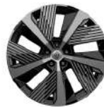
rines de aluminio de 19" con corte diamante