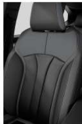
combinación de textil negro y textil refinado negro