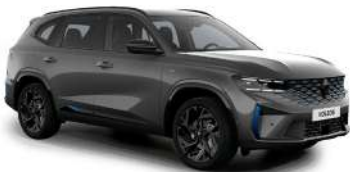
gris satinado (2)

(1) color no disponible en versión esprit Alpine techo bitono exclusivo en versión esprit Alpine (2) color no disponible en versión techno