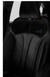
combinación de textil con acentos en Alcántara con logotipo Alpine bordado (1)