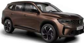
cobre mineral (1)