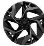
rines de aluminio de 20" en negro con corte diamante (1)

(1) solamente en la versión esprit Alpine