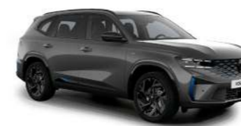
gris satinado (2)

(1) color no disponible en versión esprit Alpine techo bitono exclusivo en versión esprit Alpine (2) color no disponible en versión techno