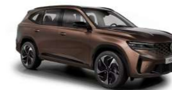
cobre mineral (1)