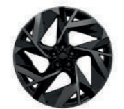
rines de aluminio de 20" en negro con corte diamante (1)

(1) solamente en la versión esprit Alpine