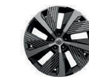
rines de aluminio de 19" con corte diamante