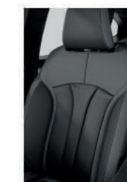
combinación de textil negro y textil refinado negro