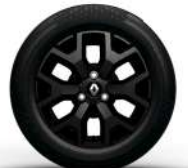
aluminio diamantado 14" Bi-tons